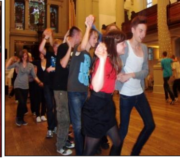
Dancing at St. Andrew's

38 Schülerinnen und Schüler der 10. und 11. Jahrgangsstufe waren vom 28. August bis 2. September 2011 in Schottland .