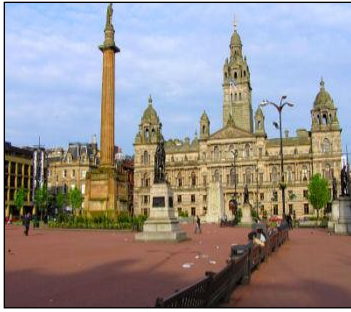
George Square and City Chambers in Glasgow