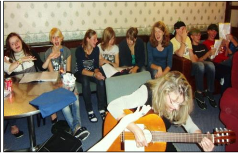
Singing at youth hostel